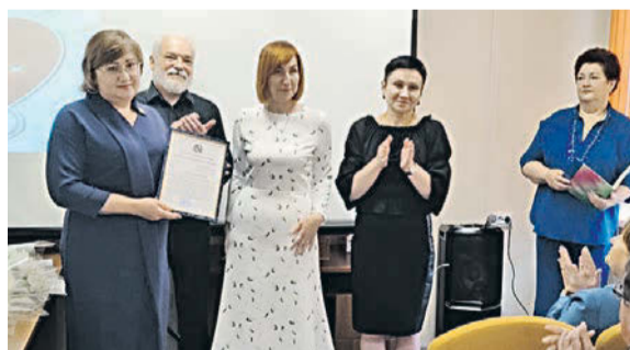
Курская городская больница №6