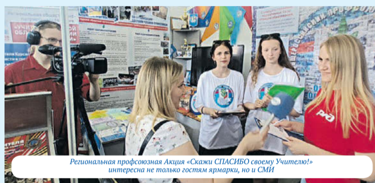
Региональная профсоюзная Акция «Скажи СПАСИБО своему Учителю!» интересна не только гостям ярмарки, но и СМИ

И еще... Именно на Коренской ярмарке 7 лет назад зародилась идея проведения региональной профсоюзной Акции «Скажи СПАСИБО своему Учителю!». Акция стала традиционной, проводится активистами областного и территориальных Молодежных советов в течение года в каждом районе и городе на различных массовых отраслевых мероприятиях, в октябре в канун празднования Дня Учителя, на Коренской ярмарке, а также на электронных площадках. За эти годы собрано и направлено педагогам Курской области и за ее пределы более 20 тысяч писем. Мы получаем много положительных откликов от тех учителей, кто получил такое письмо, и это является главным доказательством ценности