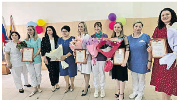
Областной противотуберкулезный диспансер