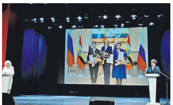
Курские горбольницы №3 и №4