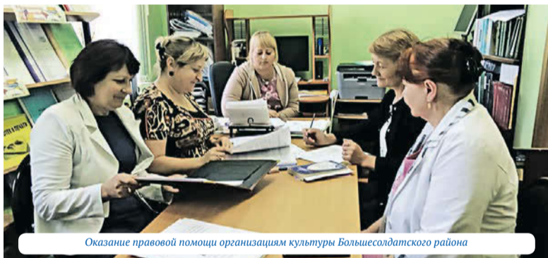
Оказание правовой помощи организациям культуры Большесолдатского района