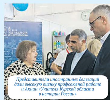
Представители иностранных делегаций дали высокую оценку профсоюзной работе и Акции «Учителя Курской области в истории России»

И еще... Именно на Коренской ярмарке 7 лет назад зародилась идея проведения региональной профсоюзной Акции «Скажи СПАСИБО своему Учителю!». Акция стала традиционной, проводится активистами областного и территориальных Молодежных советов в течение года в каждом районе и городе на различных массовых отраслевых мероприятиях, в октябре в канун празднования Дня Учителя, на Коренской ярмарке, а также на электронных площадках. За эти годы собрано и направлено педагогам Курской области и за ее пределы более 20 тысяч писем. Мы получаем много положительных откликов от тех учителей, кто получил такое письмо, и это является главным доказательством ценности