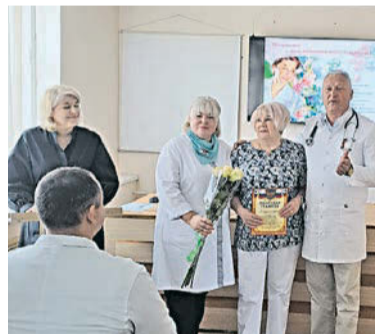
Инфекционная больница им. Н.А. Семашко