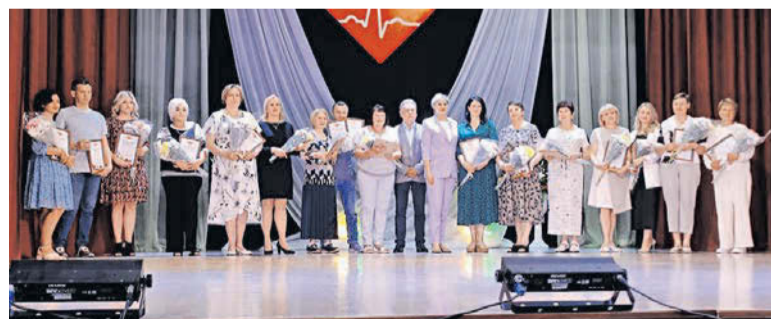
Железногорская городская больница