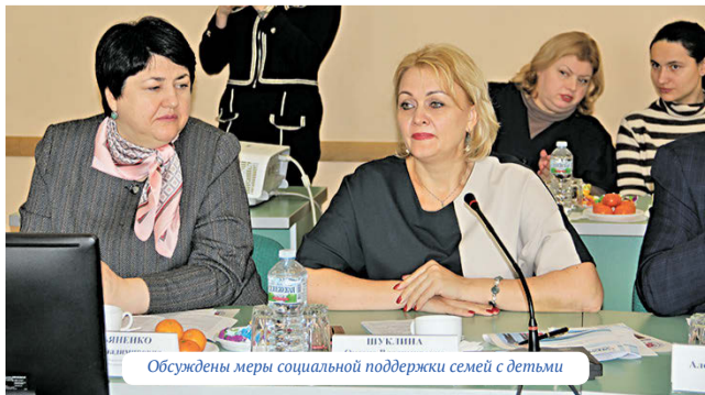
Обсуждены меры социальной поддержки семей с детьми